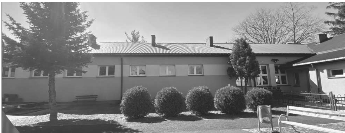
Elewacja północno-wschodnia – widok od korytarza szkolnego