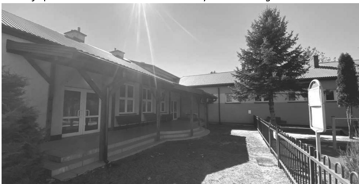
Zadaszenie nad wejściem do rozbudowanej części od placu zabaw.