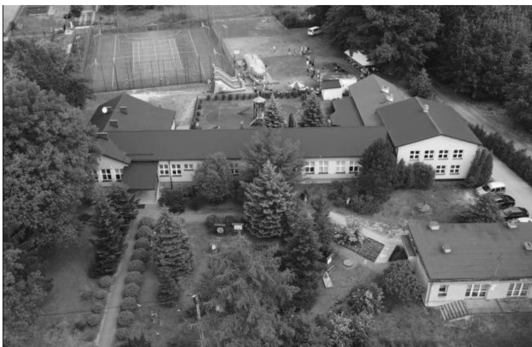
Widok z góry od południa