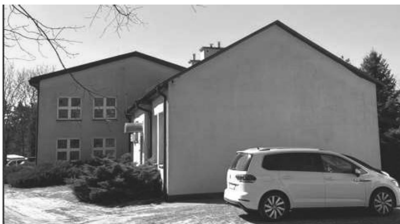
Widok na rozbudowaną część o Aulę z kotłownią, łazienkami i biblioteką